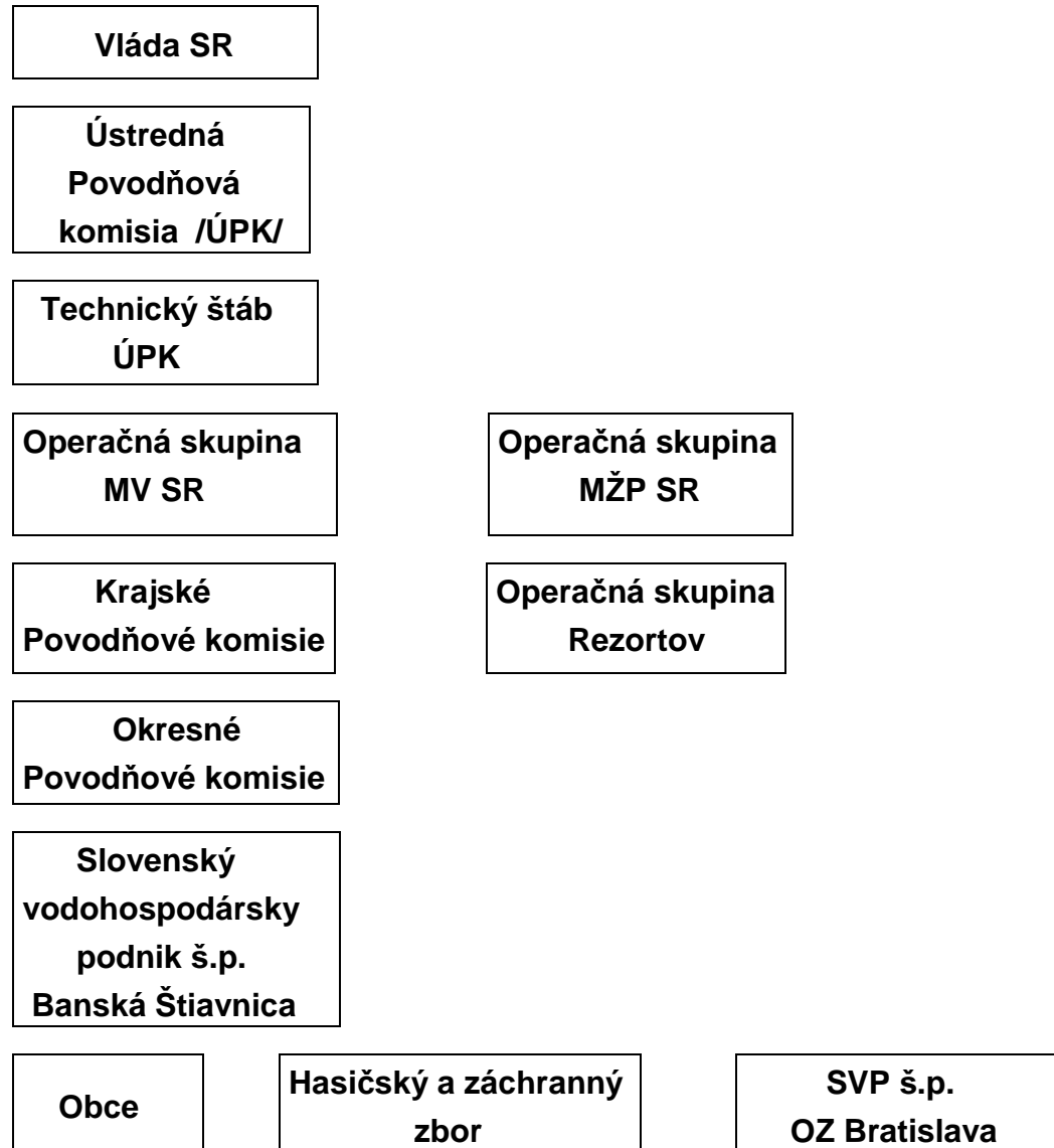
Schéma organizácie ochrany pred povodňami v SR a v Okrese